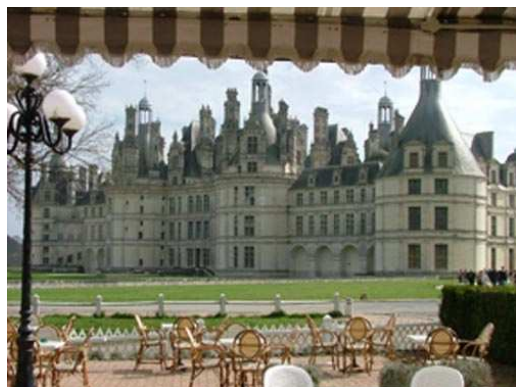
Face à l'hôtel : le château,...