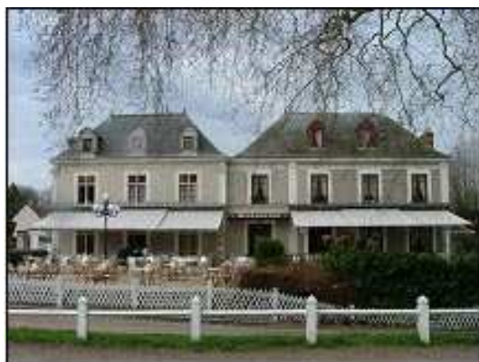
...Et face au château : l'hôtel.